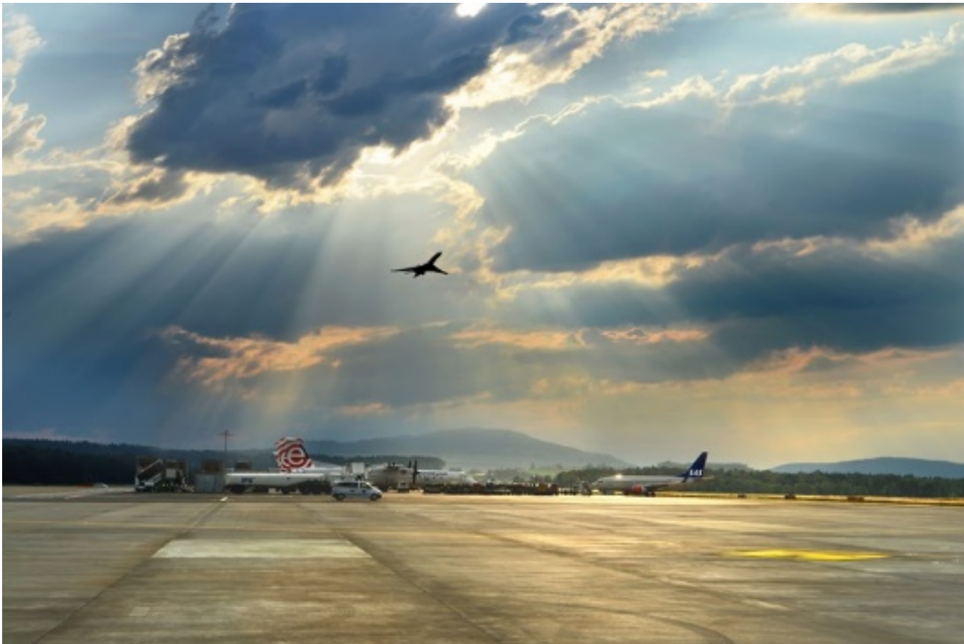
Abb. 4: https://www.flughafen-zuerich.ch/de/passagiere/erleben/erlebnisse/spotter-informationen

Durchschnittlich reisen rund 10'000 Touristen pro Tag über den Flughafen Zürich in die Schweiz ein.