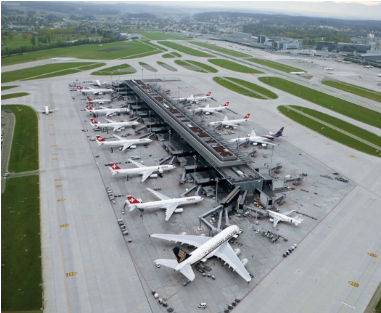
Abb. 1: Dock E des Zürcher Flughafens