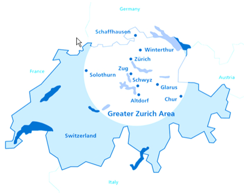
Abb. 3:

Standortvorteil: internationaler Flughafen Zürich (Kloten)